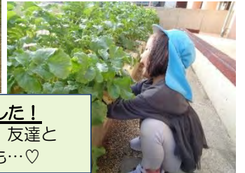
年長は大根を栽培しました！ 大きな大根が育った為、友達と 一緒に協力して抜く姿も…♡

年少はチンゲン菜を栽培しました！ 一人ずつ育てた野菜の栽培だった為、とても嬉しそうでした☆