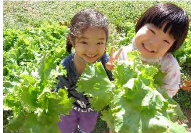
年中はレタスを育てています！ 間引きしました。チャーハンにして 食べたという子が多かったです♡